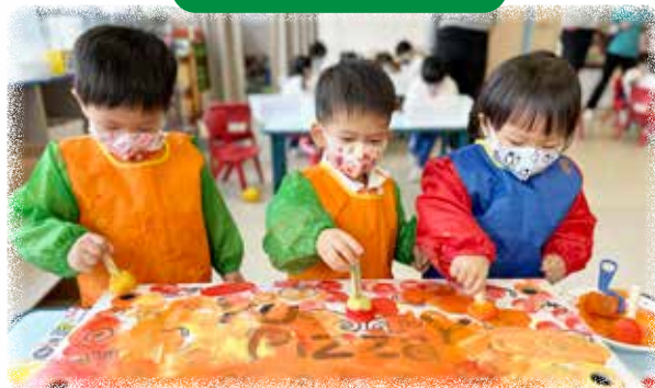
N1 幼兒合作為模擬角的披薩店添上色彩。