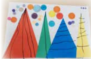
阮睿恭 —— 七彩繽紛的聖誕樹