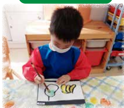
K2 幼兒正在專注地繪畫水墨畫。