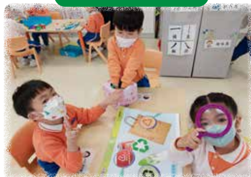
K2 幼兒正在觀察環保物料上可循環再造的標誌。