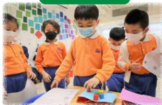
K3 幼兒正在探索紙張的承托力。