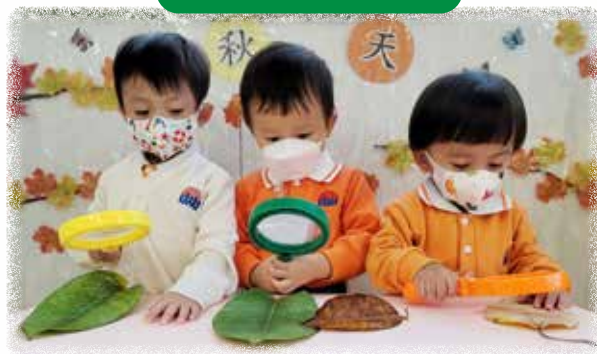
N1 幼兒正在用放大鏡探索 不同樹葉的特徵。