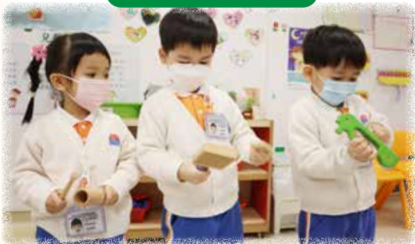
K1 幼兒和同伴一起運用不同的樂器跟隨音樂作伴奏。