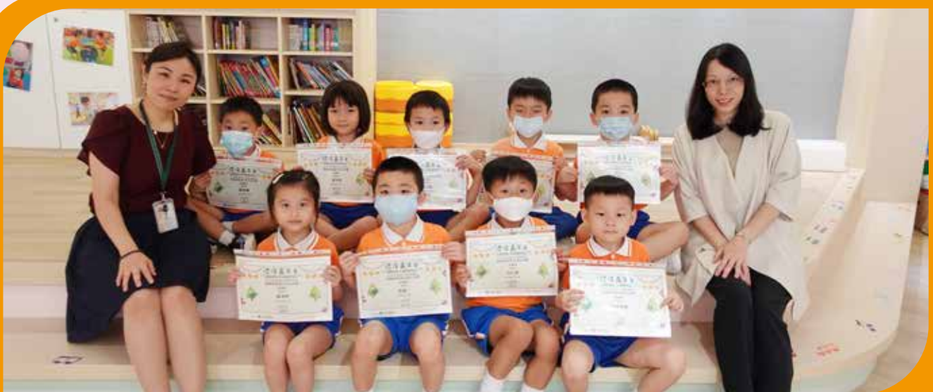
K3 環保促進會：環保嘉年華 2023 環保創意模型設計比賽