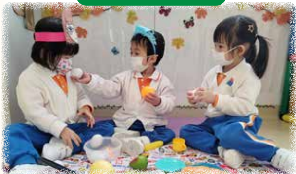
N1 幼兒模擬野餐的情景，並學習 一起分享食物。