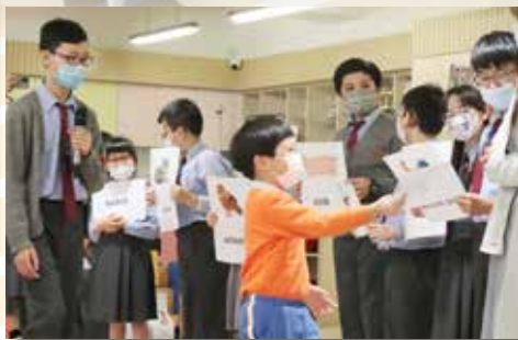
2023年1月6日 東華三院李賜豪小學 「小小語言家服務隊」 到訪進行「Farm animals」英語故事活動