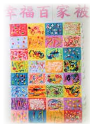
N1 班合作圖工——幸福百家被