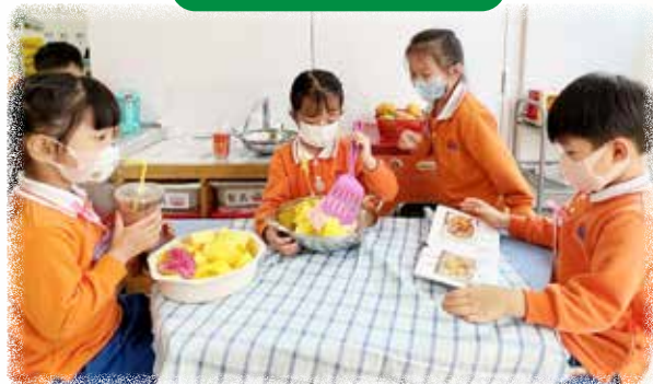
K2 幼兒正在模擬開設茶餐廳，與同伴一起學習不同食物詞彙。