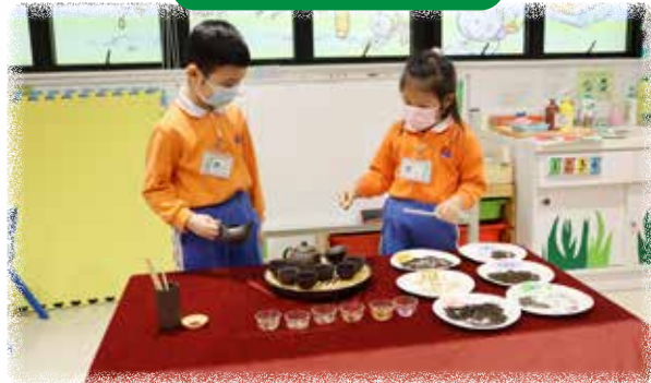
K3 幼兒正在進行與同伴介紹泡茶的步驟及分享喝茶經驗。