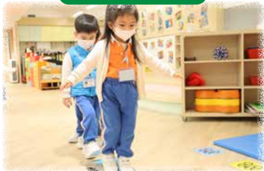
K1 幼兒正在 6 吋闊的平衡板上走路。