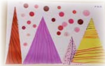
尹凱楹 —— 七彩繽紛的聖誕樹