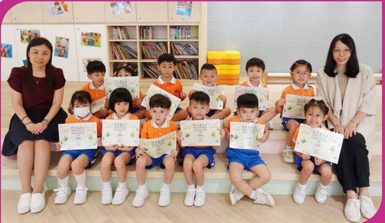
K2 環保促進會：環保嘉年華 2023 環保創意模型設計比賽