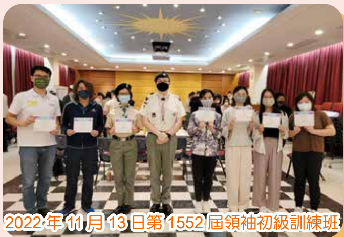
2022年11月13日第1552屆領袖初級訓練班