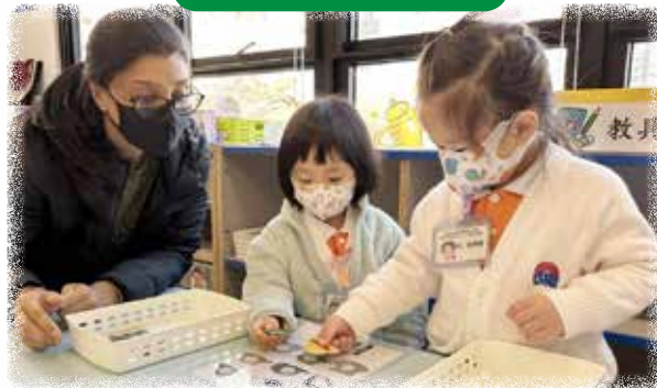
N1 幼兒與英文導師進行遊戲， 認識英文字母「H」。