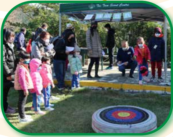
2022年12月18日 香港童軍總會 港島童軍射藝會「射箭同樂日」