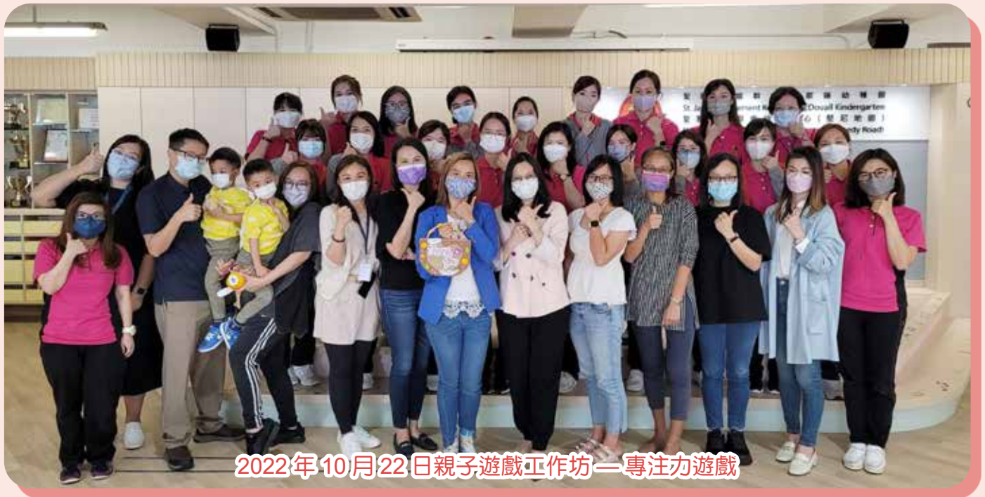
2022年10月22日親子遊戲工作坊—專注力遊戲