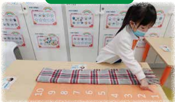
K2 幼兒正在透過親身操弄，學習量度圍巾。