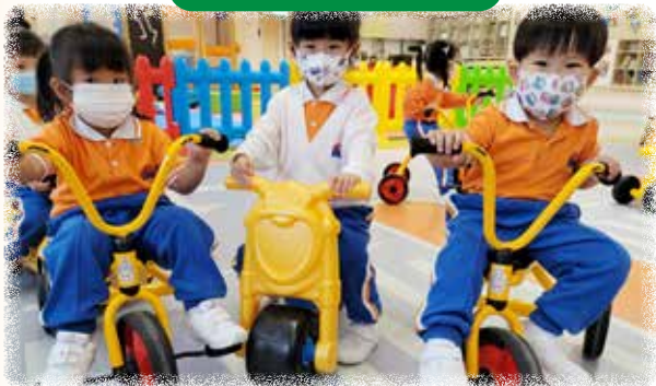
N1 幼兒正在學習踏三輪車。