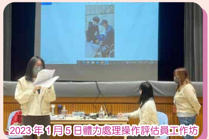
2023年1月5日體力處理操作評估員工作坊