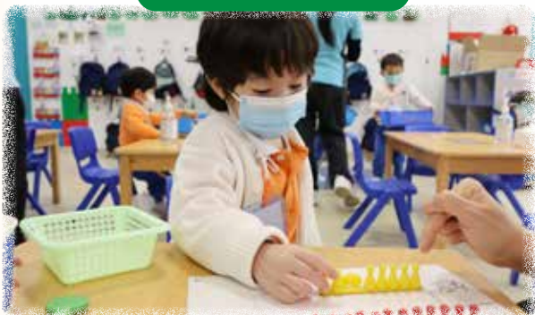
K1 幼兒透過親身體驗和操作，啟發對數學的興趣，建構基本的數學概念。