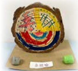
秦敬喻 —— 圖案小木塊