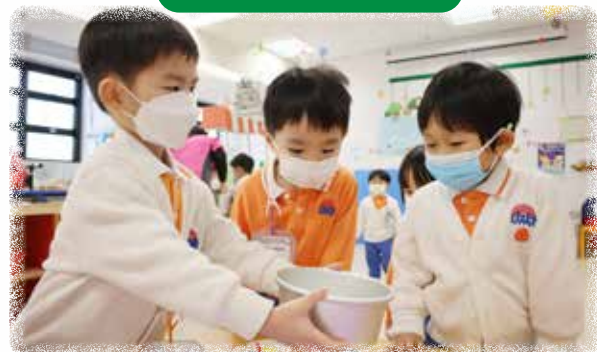
K1 幼兒觀察製作蛋糕的工具，探索焗蛋糕的方法。