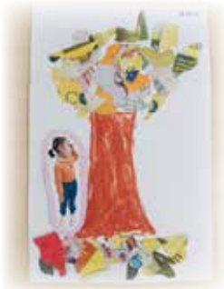
陳臻誼—— 秋天的樹木