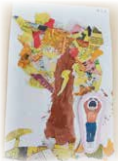
李希然 —— 秋天的樹木