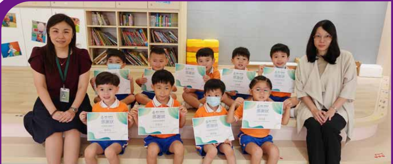
K2 環保促進會：綠在跑馬地「綠隊長教育計劃」活動