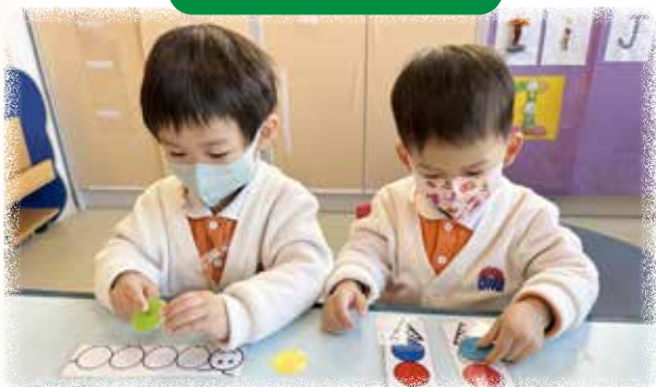
N1 幼兒正在跟着圖卡配對 相同的顏色圖形。