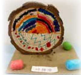
叶梓潼 —— 圖案小木塊