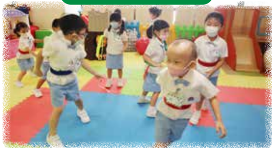
K3 幼兒正進行「搶尾巴」體能遊戲。