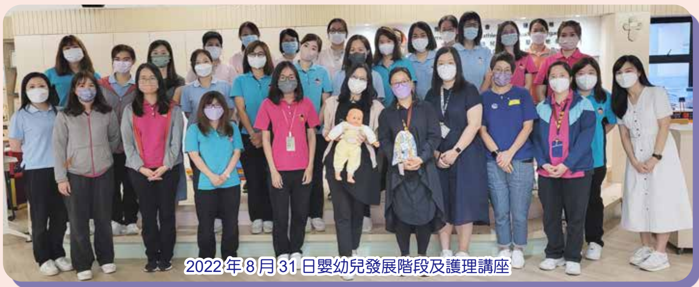
2022年8月31日嬰幼兒發展階段及護理講座