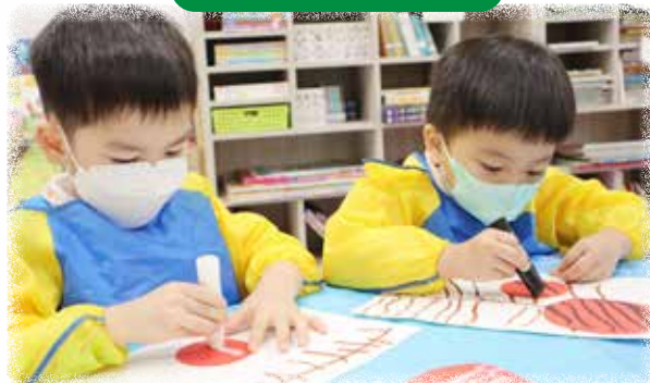
K1 幼兒正在專注地製作新年燈籠圖工。