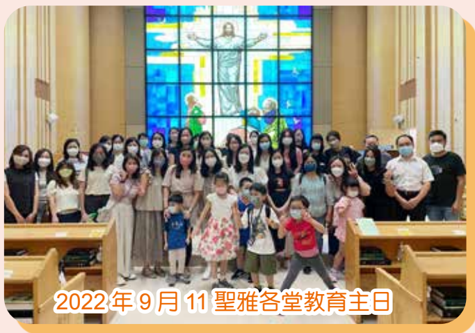
2022年9月11日聖雅各堂教育主日