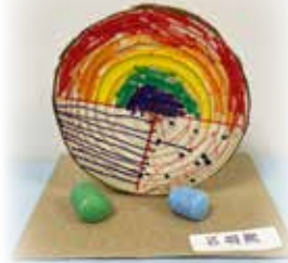
呂羽熙 —— 圖案小木塊