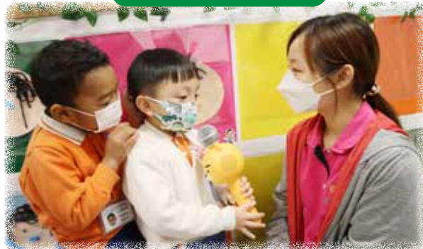
K1 幼兒向不同老師訪問製作蛋糕的方法。