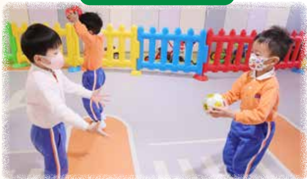
K2 幼兒正進行體能遊戲，學習雙手拋接傳球。