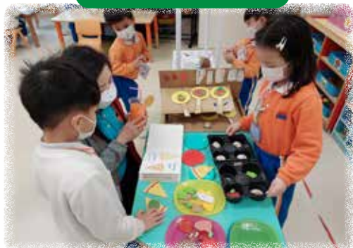
K2 幼兒與同伴在模擬角經營餐廳。