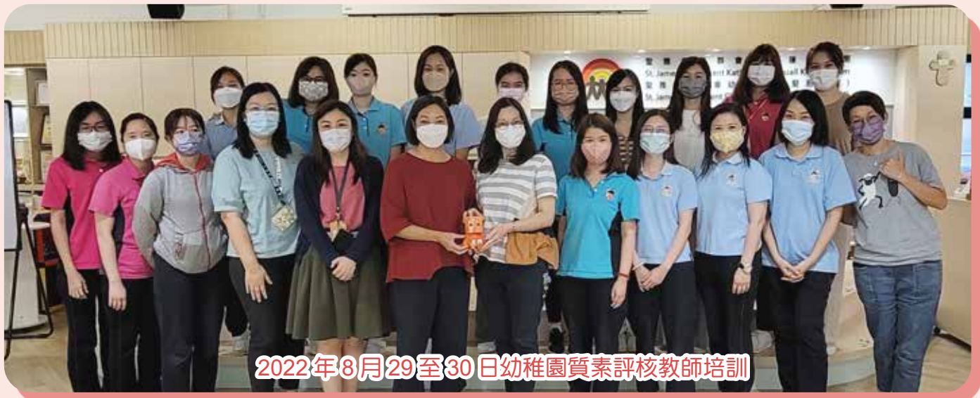
2022年8月29至30日幼稚園質素評核教師培訓