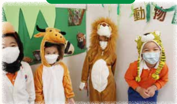
K3 幼兒與同伴在扮演不同的動物。