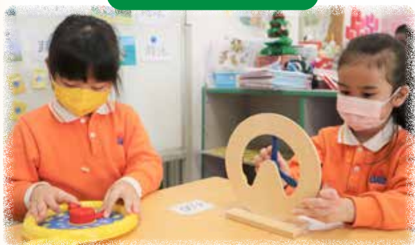
K3 幼兒正在操弄玩具時鐘，學習「時正」和「時半」概念。