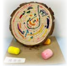
陳瑩霖—— 圖案小木塊