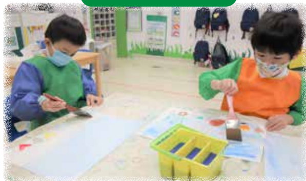
K3 幼兒正在專注地進行海底世界拒水畫創作。